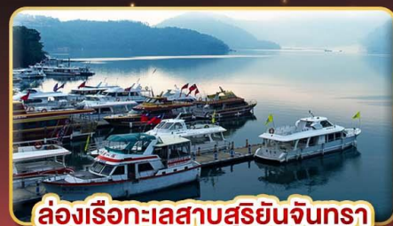
ล่องเรือทะเลสาบสุริยจีนตรา