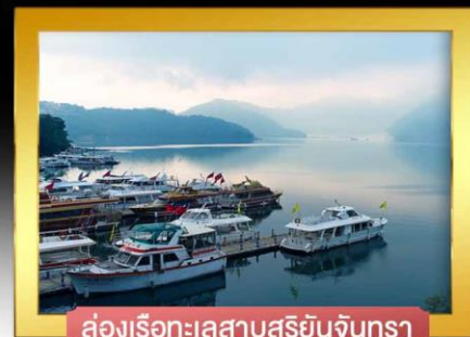
ล่องเรือทะเลสาบสุริยันจันทรา