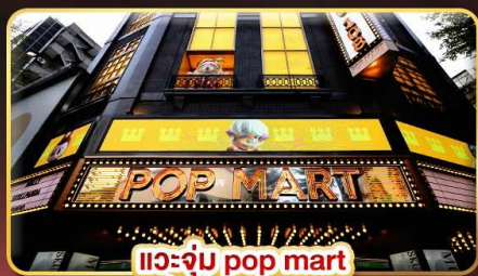
แวะช้อปปิ้ง pop mart ที่ฮิตที่สุดในซีเหมินติง